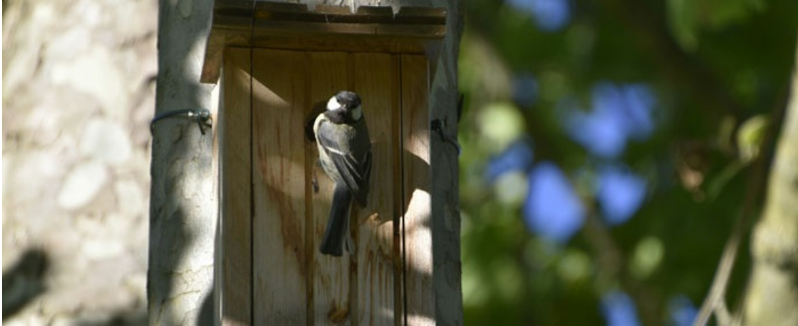
Mésange charbonnière

D'autres espèces, comme le Coucou gris ou la Huppe fasciée, consomment sans problème les chenilles lors des stades urticants. Les chauve-souris sont aussi de précieux alliés pour réduire les populations du papillon de la processionnaire du pin, dont elles s'alimentent.