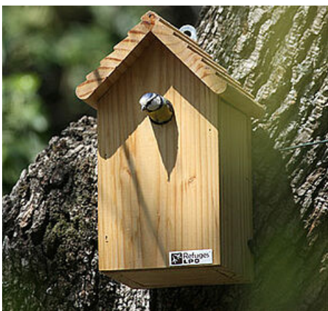
Mésange bleue

D'autres espèces, comme le Coucou gris ou la Huppe fasciée, consomment sans problème les chenilles lors des stades urticants. Les chauve-souris sont aussi de précieux alliés pour réduire les populations du papillon de la processionnaire du pin, dont elles s'alimentent.