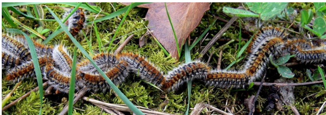
Chenilles processionnaires

La Processionnaire du pin est la chenille du papillon de nuit Thaumetopoea pityocampa , qui effectue une partie de son cycle de développement dans les pins, mais aussi le cèdre de l'Atlas et le Mélèze d'Europe. Si l'adulte est peu connu, sa forme larvaire en revanche, la fameuse « chenille processionnaire », est un nuisible tristement célèbre ! Recouverte de milliers de poils urticants, elle est en effet responsable de réactions allergiques plus ou moins graves chez l'homme et les animaux. Ce ravageur, qui se développe en 5 stades larvaires successifs, se nourrit également des aiguilles des conifères qu'elle affecte, entraînant ainsi des défoliations qui fragilisent les arbres et ralentissent leur croissance.