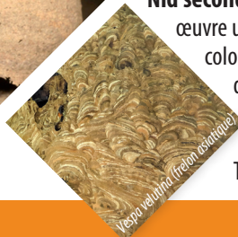
Vespa velutina (frelon asiatique)

Nid secondaire : les ouvrières mettent en œuvre un nouveau nid qui hébergera la colonie. Le nid est situé à proximité d'un point d'eau pour que les frelons puissent élaborer la pâte à bois qui le constitue. Taille : entre 20 et 60 cm