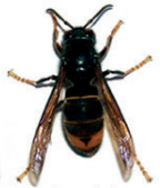
Frelon asiatique ( Vespa velutina )