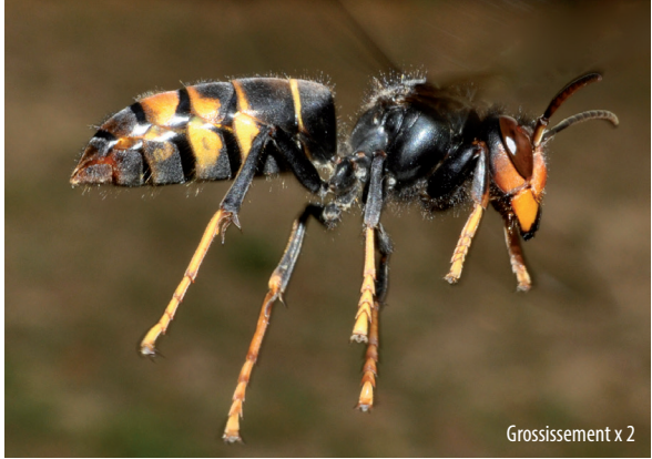
Grossissement x 2

Alimentation : mouches, guêpes, mais surtout abeilles (pour nourrir ses larves), fruits mûrs et nectars.