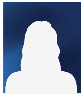
Stéphanie AVENIA (suppléante)