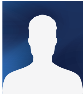
Gilles TAGGIASCO (suppléant)