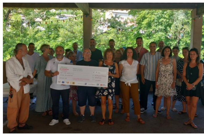
Pizzeria La Calade 10, rue de l'Eglise 06910 LA ROQUE EN PROVENCE