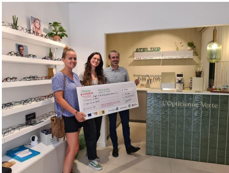
L'Opticienne Verte 5, rue Vauban 06600 ANTIBES https://lopticienneverte.com/