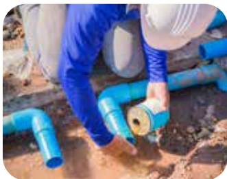
Installer des clapets anti-retour