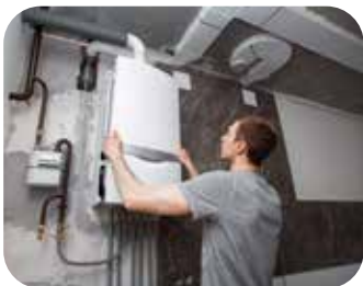
Réhausser les équipements électriques