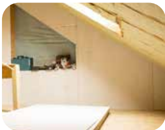
Aménager une zone de refuge