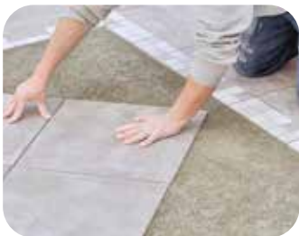
Améliorer l'étanchéité des murs et sols