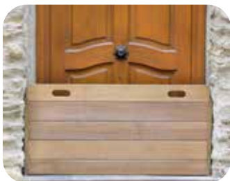
Poser des batardeaux