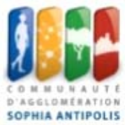
Liste donnée à titre indicatif